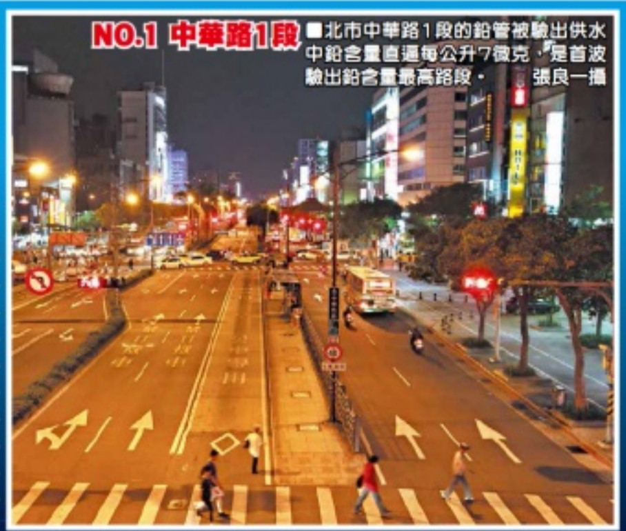
北市中華路1段的鉛管被驗出供水鉛含量直逼每公升7微克，是首波驗出鉛含量最高路段。

註：表列單位「微克/公升」，飲用水鉛含量依規定每公升不得逾10微克，不過10微克為容許上限，非安全含量，因為鉛可在人體累積毒性。