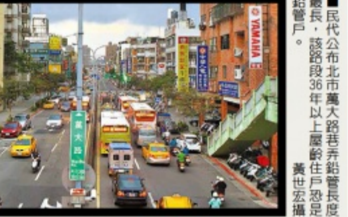
■民代公布北市萬大路巷弄鉛管長度最長，該路段36年以上屋齡住戶恐足鉛管戶。