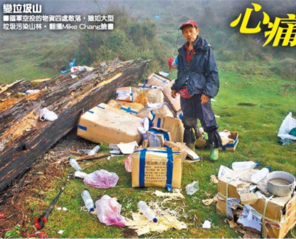
變位坂山 ■國軍空投的物資四處散落，猶如大型垃圾污染山林。