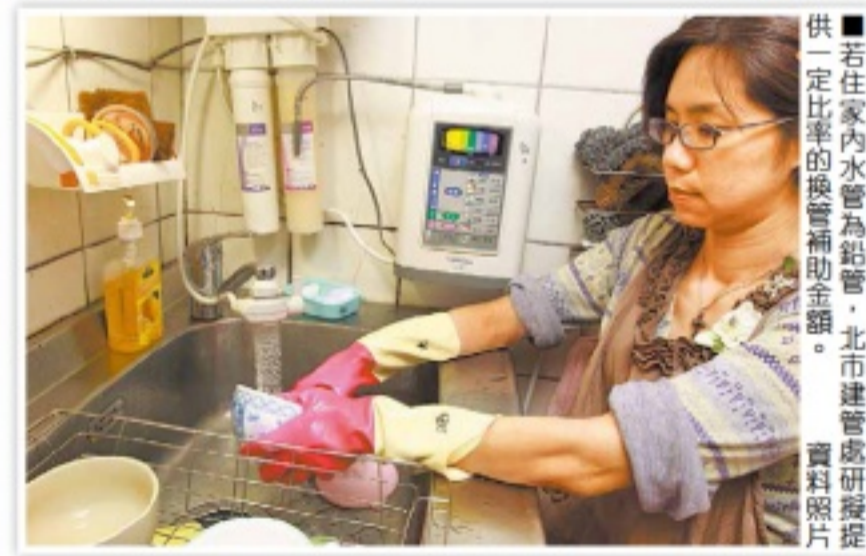
若住家內水管為鉛管，北市建管處研擬提供一定比率的換管補助金額。資料照片