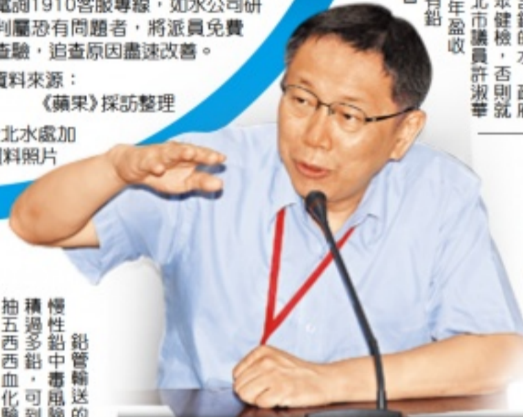
台北市長柯文哲昨令北水處加速汰換鉛管時程。